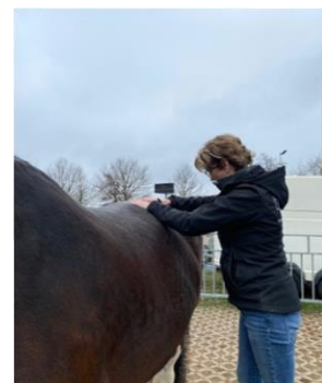
Fascia behandeling in de structuren