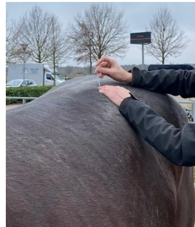
- Dryneedling in de omliggende structuren

Massage, stretchen, werken aan de hand, balkjes lopen en dressuuroefeningen zijn hiervoor enkele voorbeelden.